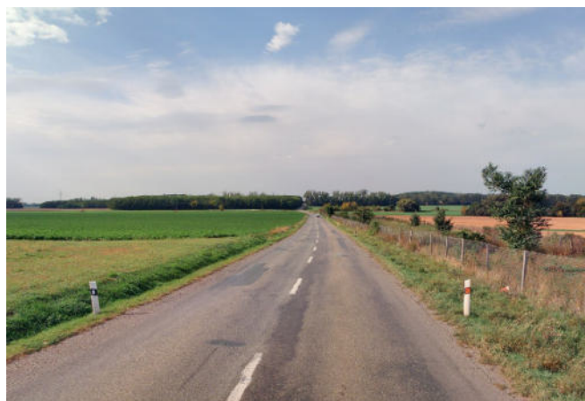
Stav silnice po rekonstrukci