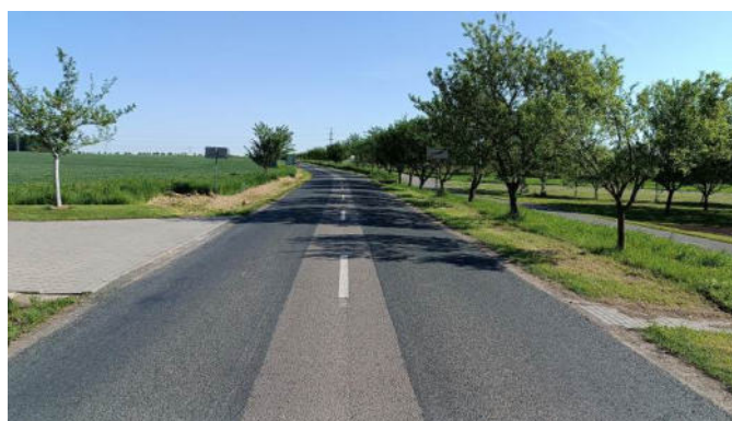
Stav silnice po opravě