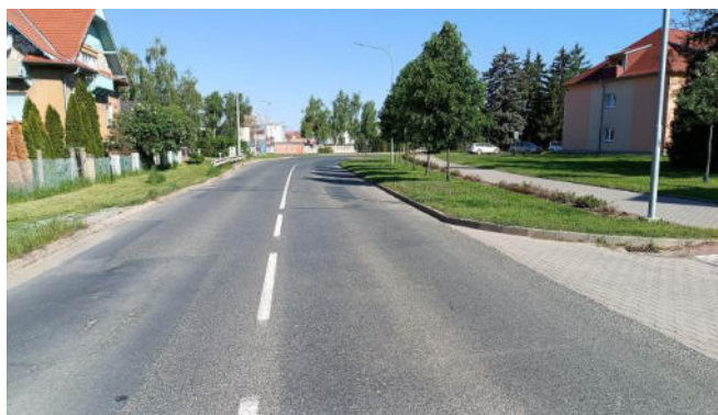
Stav po opravě