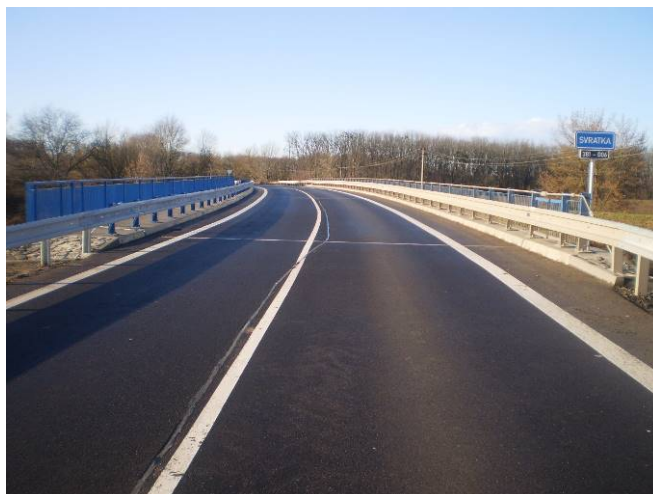
Stav po rekonstrukci

Zdroj financování: SFDI, IF OBNOVA MOSTŮ