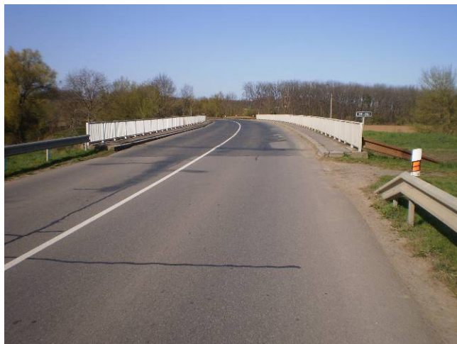
Stav před rekonstrukcí

Projektant: Projekční kancelář PRIS spol. s r.o.