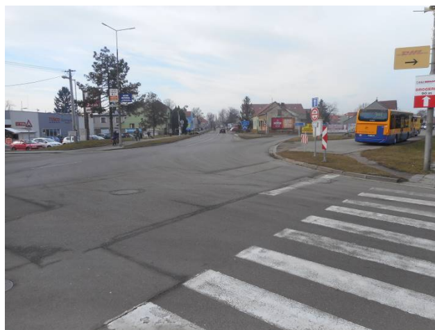
Stav křižovatky po rekonstrukci