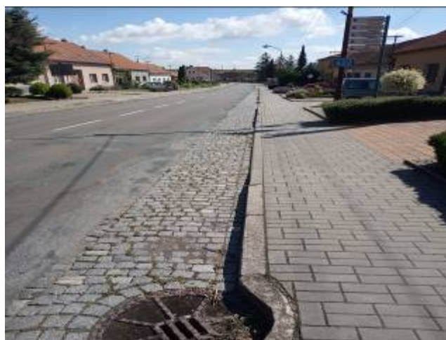
Stav po rekonstrukci