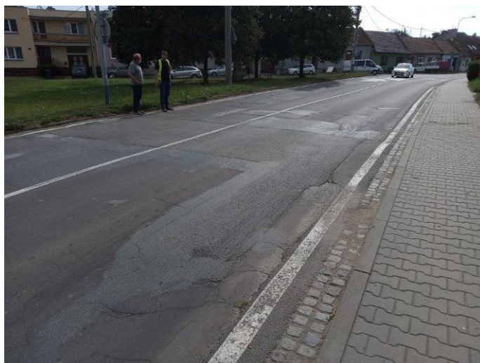
Stav silnice po rekonstrukci