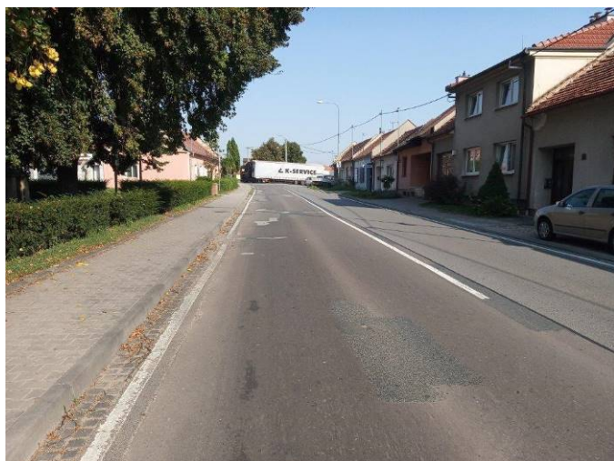
Stav silnice před rekonstrukcí