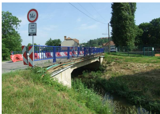
Stav po rekonstrukci