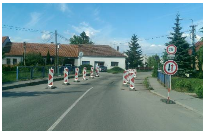
Stav během rekonstrukce

Projektant: Projekční kancelář PRIS spol. s r.o.