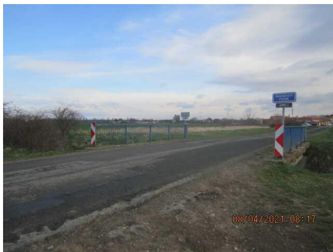
Stav po rekonstrukci

Zdroj financování: ZAJIŠTĚNÍ BEZPEČNOSTI MOSTŮ, SFDI