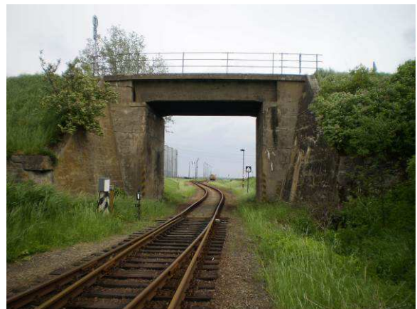
Po rekonstrukci mostů ev.č. 4203-3,4