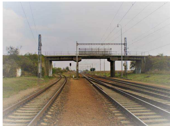
Stav před rekonstrukcí mostu ev.č.4203-4